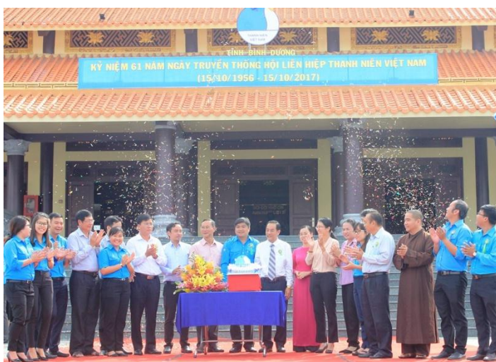
Thường trực Tỉnh Đoàn, Thường trực Hội LHTN tỉnh và Hội LHTN các huyện, thị, thành phố cùng đại biểu cắt bánh chúc mừng sinh nhật Hội

Trong không khí vui tươi, sôi nổi và ấm cúng tại chương trình đại biểu cùng các bạn thanh niên đã cắt bánh chúc mừng sinh nhật lần thứ 61 của Hội LHTN Việt Nam.